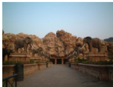
Bridge of time, Sun City