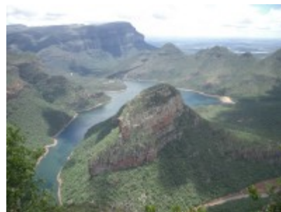
Blyde River Canyon