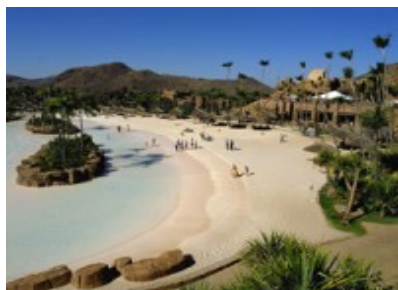
Valley of the waves

Po śniadaniu wyjazd do Sun City - afrykańskiego Las Vegas. Zobaczymy Lost City , pobyt w Dolinie Fal , tropikalnych ogrodach, kompleksie kasyn. Krótka wizyta w Crocodile Sanctuary – rezerwacie krokodyli. Powrót do hotelu, kolacja w restauracji, nocleg.