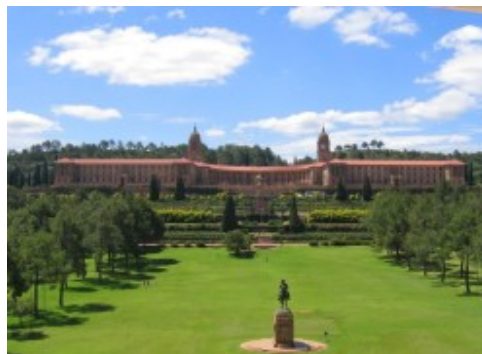
Union Buildings w Pretorii