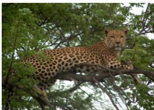
Lampart w Parku Krugera

największy Park Narodowy w Południowej Afryce - godz. 6.00 - przesiadka do otwartych samochodów terenowych w poszukiwaniu “Wielkiej Piątki” - LWY, SŁONIE, CZARNE NOSOROŻCE, LAMPARTY i BAWOŁY. Po południu przejazd do Rezerwatu Gepardów (hodowla i rozwój tego gatunku). Nocne safari - niesamowita przygoda połączona z akcją tropienia zwierzyny, a zakończona kolacją – z afrykańską dżiczyzną - w Bomie (palisada chroniąca przed niespodziewanymi gośćmi w postaci drapieżników), powrót do hotelu, nocleg.