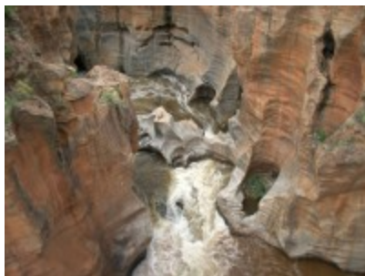
Bourke's Luck Potholes